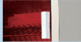
安全開門設計， 一開即停UV燈