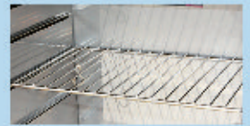
活動式層板， 按個人需要更改